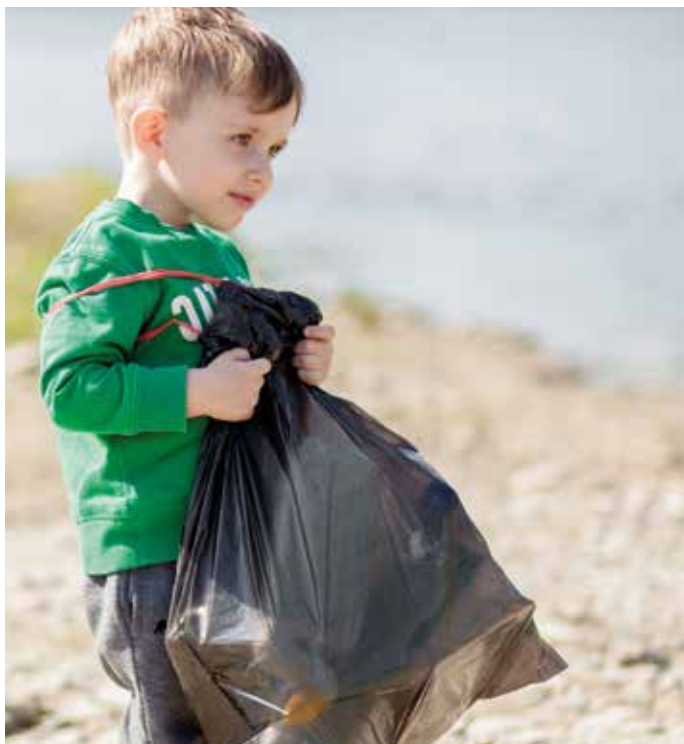
Små barn når inte och vet inte var dom skall slänga avfallet. Utan hjälp hamnar avfallet lätt utanför kärlen/inkasten.

Avfall som placeras utomhus och/eller utanför kärlen ser inte bara ovårdat ut och luktar illa, utan riskerar även att dra till sig oönskade skadedjur. Vaktmästare blir också tvungna att ta tid från andra viktiga arbetsuppgifter och serviceuppdrag för att städa upp både utemiljö och soprum.