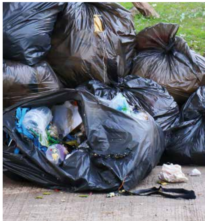
Avfall utanför kärnen/inkasten luktar och drar till sig skadedjur, som tar sönder påsarna. Det blir vaktmästarna som får städa.